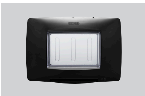
Colori: bianco, nero e titanio Modularità: 3 posti Adatta per: scatola rettangolare