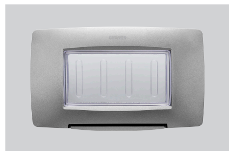
Colori: bianco, nero e titanio Modularità: 4 posti Adatta per: scatola rettangolare