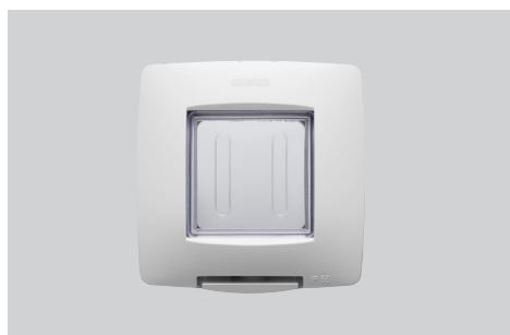
Colori: bianco, nero e titanio Modularità: 2 posti Adatta per: scatola tonda/quadrata